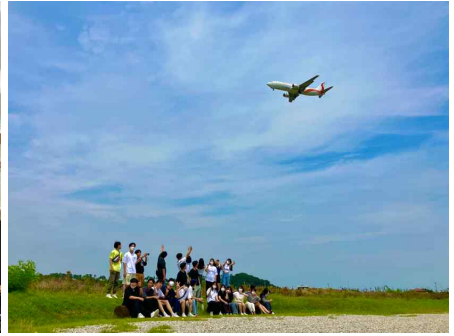
1박2일 갯벌체험 현장체험학습: 영종도