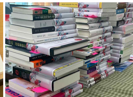
학습 교재 및 도서, 자료 지원