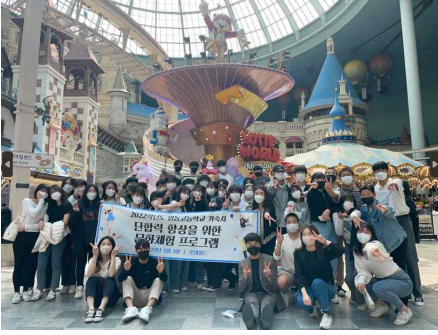
공동체 역량 강화 현장체험학습: 롯데월드