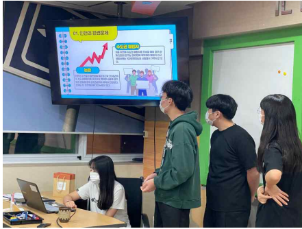
주제 탐구 프로젝트