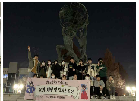
캠퍼스투어 (강원대, 고려대)