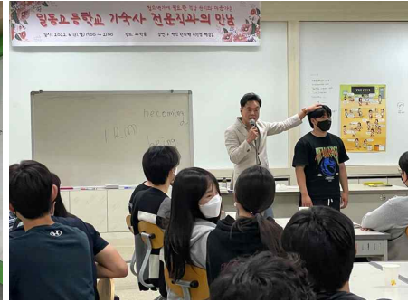
진로 특강: 한의사