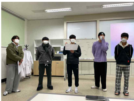
신입생 환영회 및 오리엔테이션