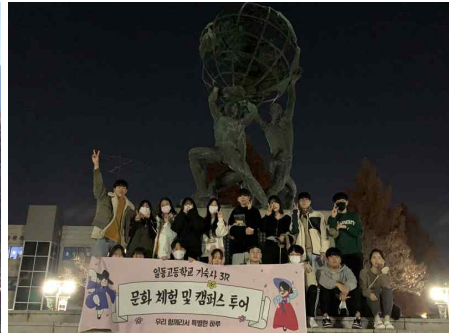
김유정 문학촌 문학기행 및 캠퍼스투어