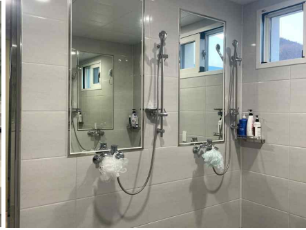
탈의실 및 샤워실