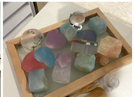
원데이클래스: 비누 만들기