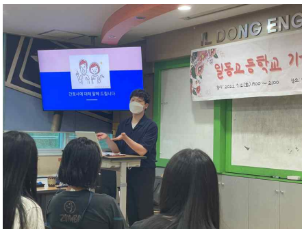
진로 특강: 간호사