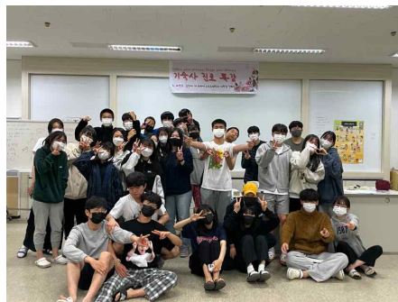
진로 특강: 스포츠의학과 재학생