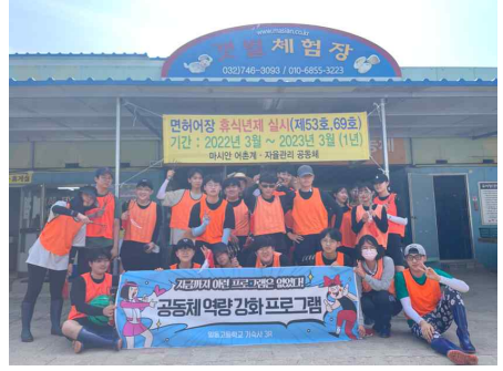
1박2일 갯벌체험 현장체험학습: 영종도